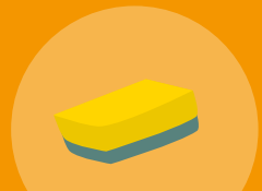
GOBICA ZA POSODO