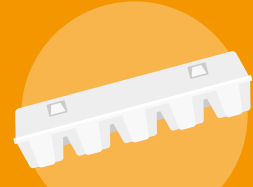
ŠKATLA OD JAJC