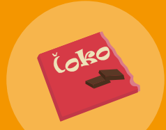
OVOJ OD ČOKOLADE